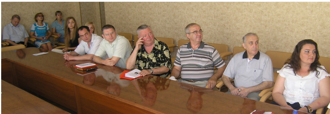
• Наукова конференція «Деякі сучасні проблеми математики та механіки» до 65-річчя члена-кореспондента НАН України О. А. Бойчука, Слов'янськ, 8 – 10 вересня 2015 р.