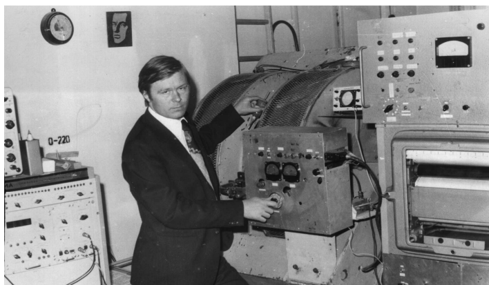
Лабораторія біофізики (1985 рік)

У короткий термін за допомогою лаборантів та допоміжного персоналу були обладнані і стали придатними до проведення занять лабораторії загальної фізики, методики викладання фізики, електротехніки і радіоелектроніки, оснащенні необхідним обладнанням наукові лабораторії з фізики твердого тіла, у яких згодом було виконано ряд важливих наукових досліджень з фізики напівпровідників.