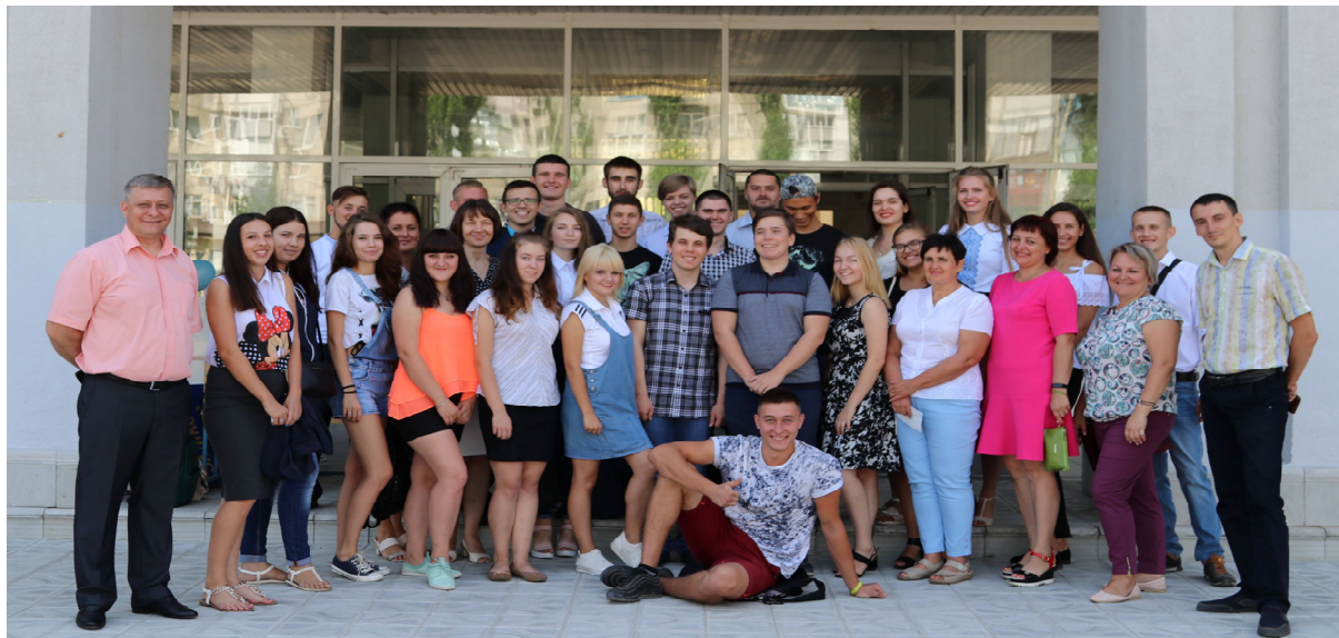
«Посвята у студенти», 2018 р.

Долаючи труднощі, факультет рухається вперед, пристосовуючись до нових реалій і викликів навколишнього світу та, все ж, зберігає свої традиції. Оновлюємо матеріальну базу, ліцензуємо нові спеціальності, удосконалюємо форми роботи із вступниками.