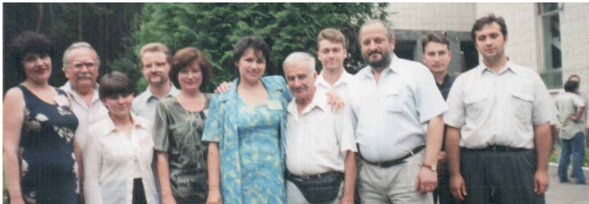
• Міжнародний науковий семінар «Теорія апроксимації в Європейському контексті: підходи, застосування, перспективи», Слов'янськ, 16 – 17 серпня 2007 р.