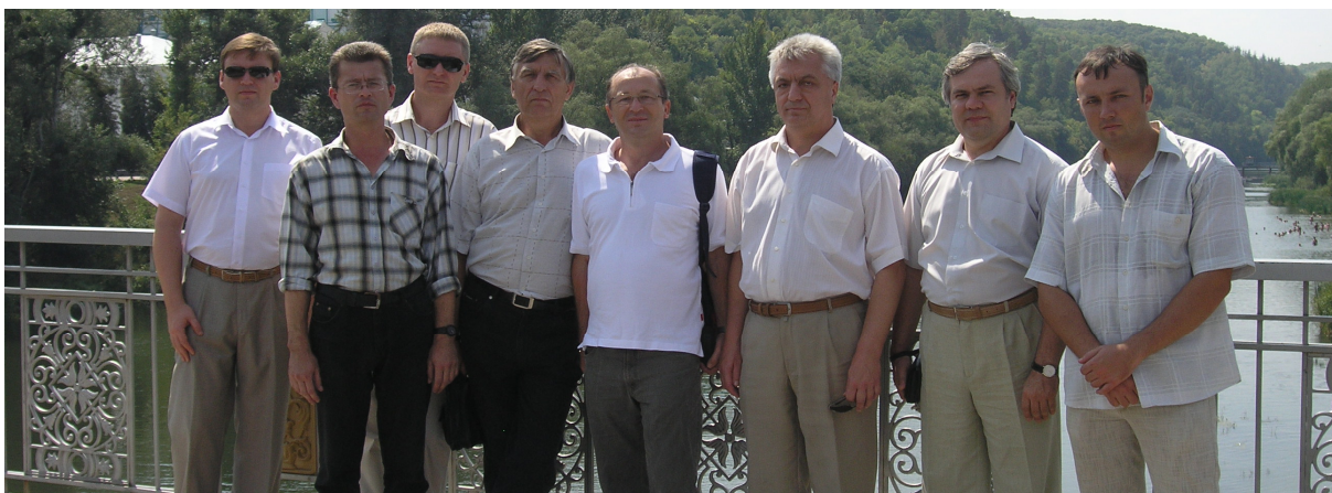
• Міжнародний семінар «Smoothness, approximation and related topics», Слов'янськ, 8 – 10 червня 2010 р.