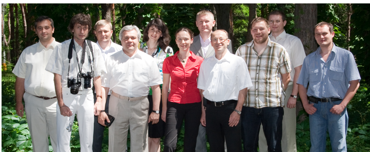
• Міжнародна наукова конференція «Крайові задачі, теорія функцій та їх застосування» з нагоди 75 – річчя академіка А. М. Самойленка, Слов'янськ, 12 – 14 червня 2013 р.