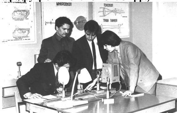
Лабораторія оптики (1986 рік)