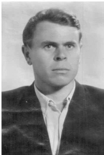
Сологуб Володимир Степанович