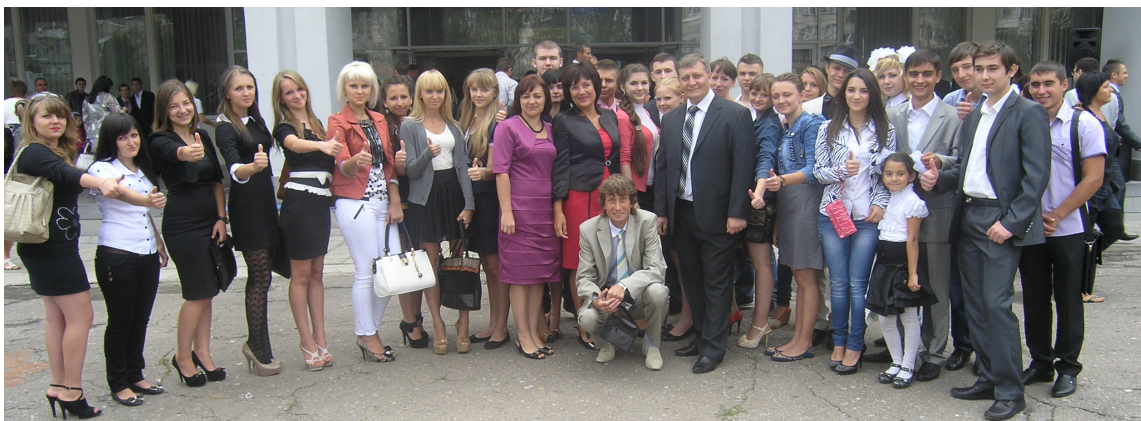
«Посвята у студенти», 2013 р.

спеціальностей «Математика*» та «Фізика*» за ОКР бакалавра, спеціаліста й магістра.