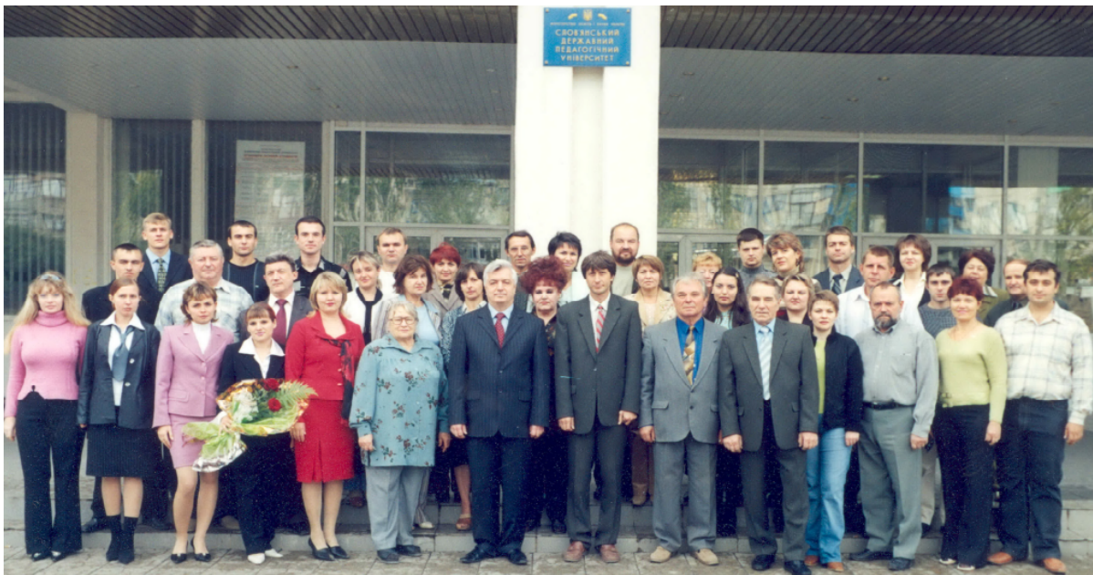
Колектив фізико-математичного факультету, 2005–2006 н.р.